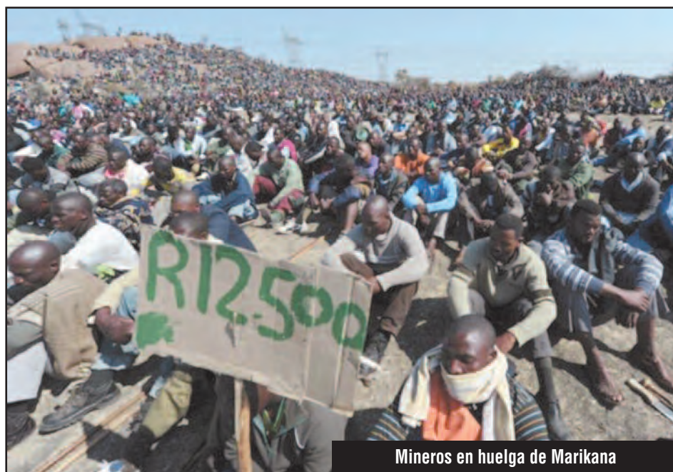
Mineros en huelga de Marikana

Para esta lucha es que le pedimos su aporte financiero, para que nunca más queden cercadas las luchas de la clase obrera, como la de los heroicos mineros de Marikana en el sur de África que sostuvieron 5 meses de huelga contra la Angloamerican. La burocracia sindical inglesa de las Trade Union que ayer proclamaba “trabajo inglés para los ingleses” cuando sus jefes del imperia-