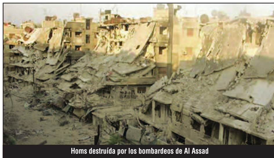
Homs destruida por los bombardeos de Al Assad

Pedimos su aporte a los que peleamos porque vuelva el grito de la juventud chilena contra el PC de "Los pacos rojos son los peligrosos", que es la consigna contra el stalinismo que entrega la resistencia obrera y campesina en Colombia para que sea masacrada, al mismo tiempo que restaura el capitalismo en Cuba y entrega la isla a la Cargill y los yanquis.