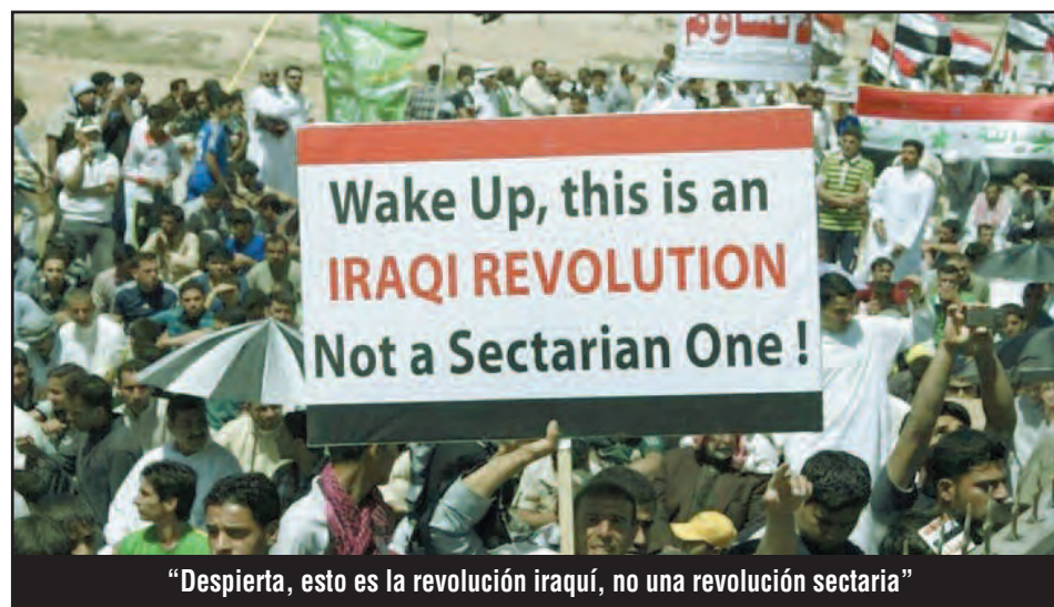
"Despierta, esto es la revolución iraquí, no una revolución sectaria"

En su bancarrota, el imperialismo ha dejado fuera del proceso productivo a mil millones de obreros del mundo. Ha destruido y destruye la fuerza