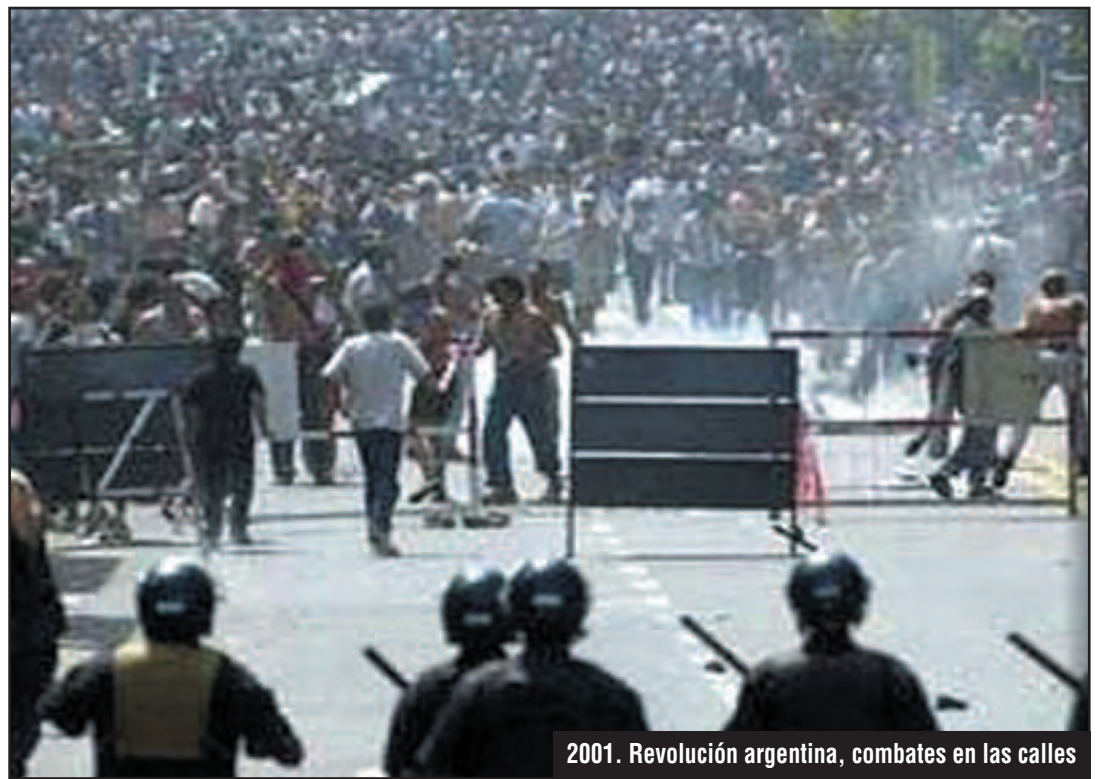
2001. Revolución argentina, combates en las calles

HEMOS INICIADO NUESTRO COMBATE POR PONER EN PIE UN NUEVO PARTIDO REVOLU-