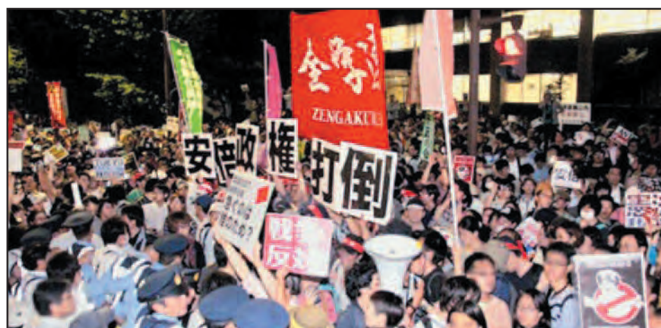
Movilización de la JRCL enfrentando al gobierno de Abe y la traición del stalinismo y el reformismo en las organizaciones obreras y de lucha de las masas de Japón

Nuestras fuerzas para triunfar están afuera, son los presos palestinos en las cárceles sionistas, son los obreros calumniados por el reformismo en Irak, Siria y Libia, son los mineros de Marikana... nuestras fuerzas son las de los miles de niños presos por ser inmigrantes en las cárceles de Obama, nuestras fuerzas están en la clase obrera china, en los trabajadores de Atenas que volverán a luchar para incendiar la Europa imperialista. Nuestras fuerzas son las de los mineros del Donbass en Ucrania, la tierra donde fuera victorioso el Ejército Rojo de Lenin y Trotsky a principios del siglo XX.