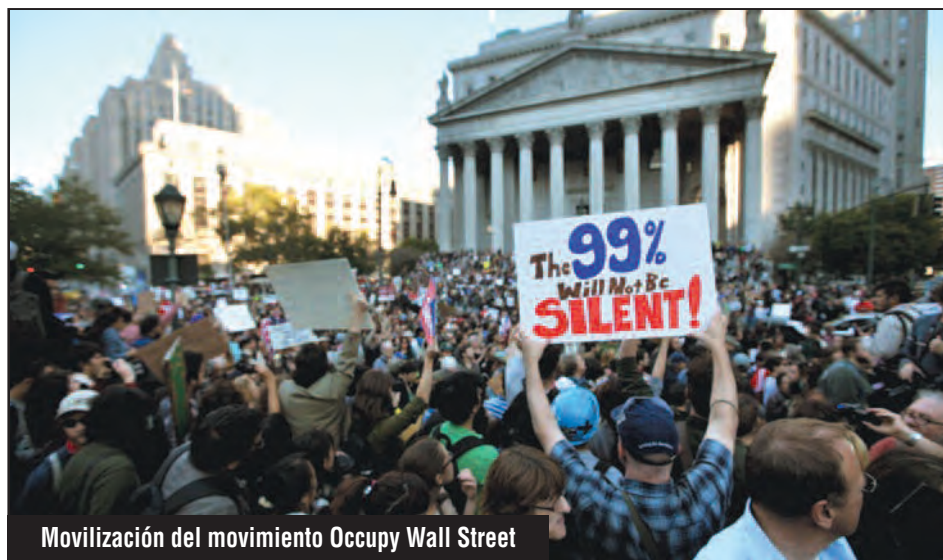
Movilización del movimiento Occupy Wall Street

Los trotskistas de la WIL de África del Sur lucharon y luchan junto a los aguerridos mineros que enfrentan a la Angloamerican en el África martirizada