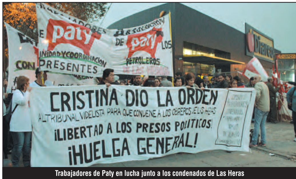
Trabajadores de Paty en lucha junto a los condenados de Las Heras

En Irak, los que se han rebelado e insurreccionado no son “tribus”, es la grandiosa clase obrera que sufre y padece en los pozos de petróleo de las transnacionales imperialistas de Bush y Obama. Se han rebelado los parias que no soportan más esa colonia yanqui. Es el imperialismo el que ve disolverse el ejército de su protectorado y envía, vía la burguesía saudí, a la burguesía sunita, al Estado Islámico de Irak y el Levante, como ya dijimos,