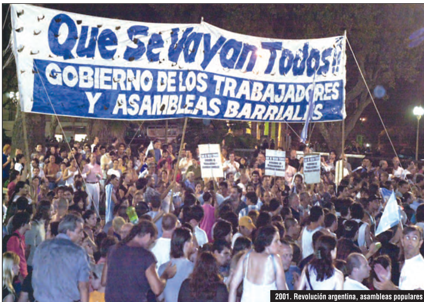
2001. Revolución argentina, asambleas populares

Desde ya, su aporte será muy valioso. Pero mucho más valioso será si luchamos juntos. Se trata de que la lucha de los esclavos se transforme en victoria. La alternativa es clara: socialismo o barbarie. •